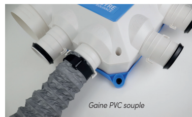
Gaine PVC souple