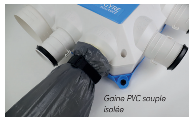
Gaine PVC souple isolée