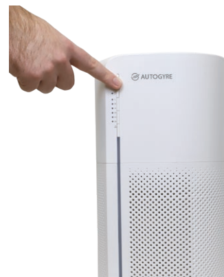
Panneau de commande