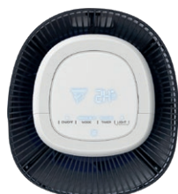
Panneau de commande