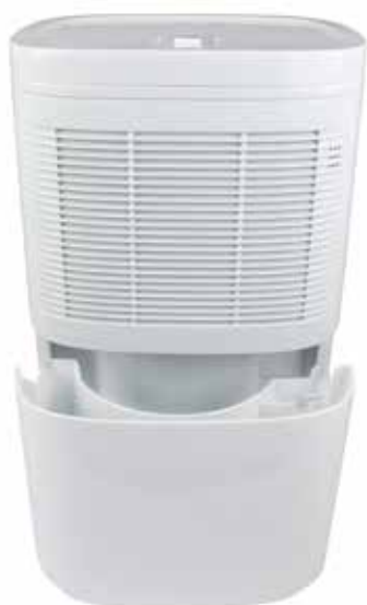
Réservoir 2,2 l