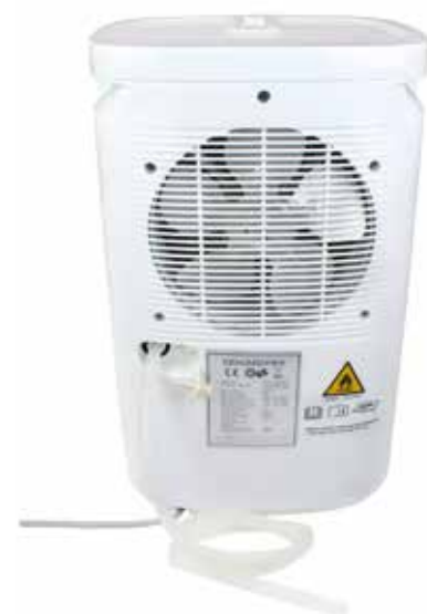
Option évacuation directe des condensats