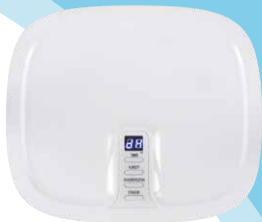
Panneau de commandes