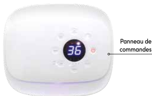
Panneau de commandes